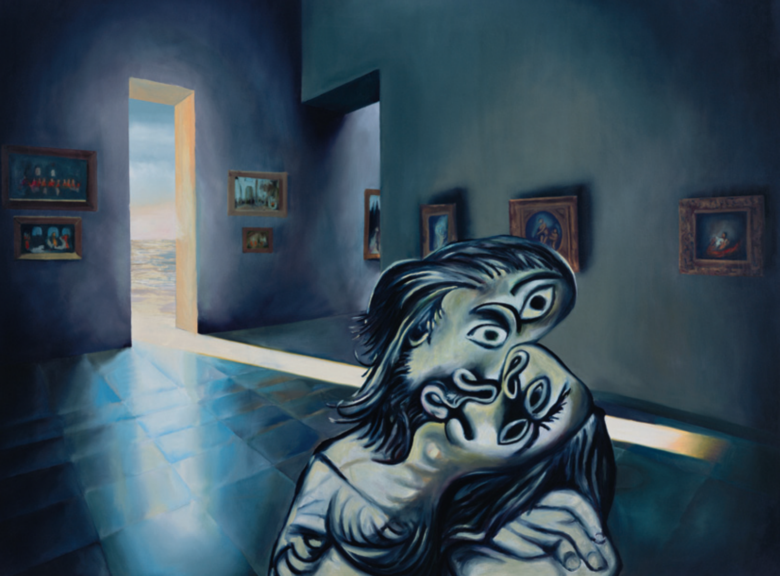
La Chambre froide de Locus Solus , 2010 huile sur toile, 97 x 130 cm, inv. 1411