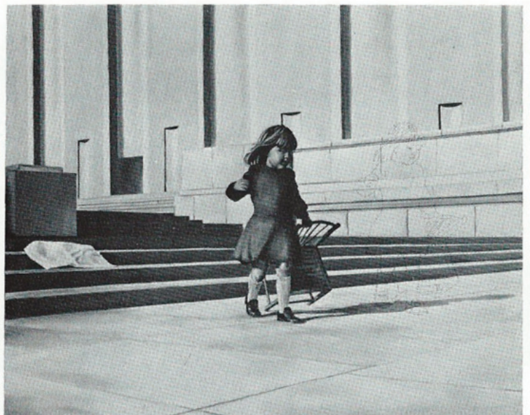
"silla" Paris 1974 huile/toile 162 x 130 cm